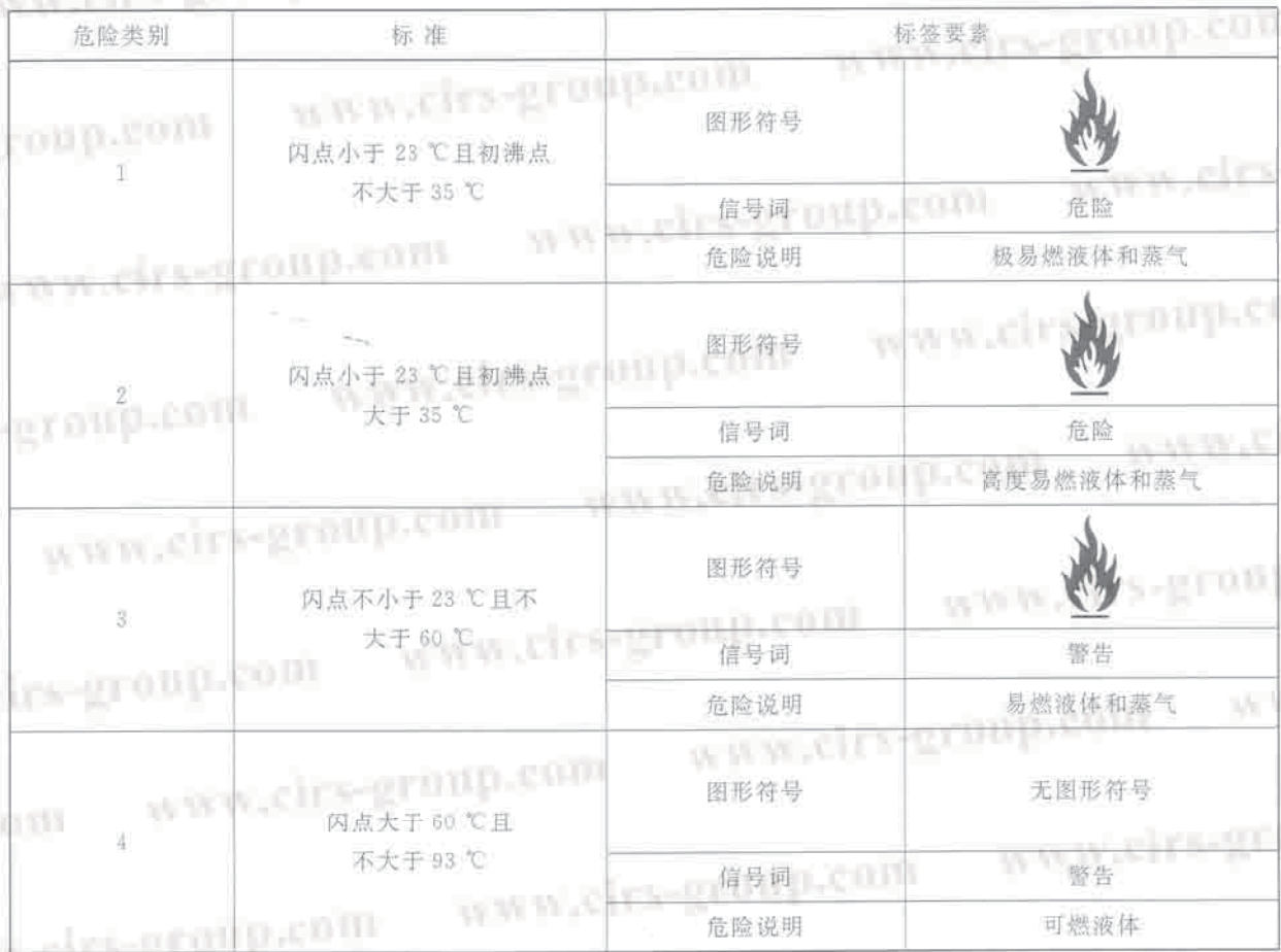
表 C.1 易燃液体分类标准和标签要素