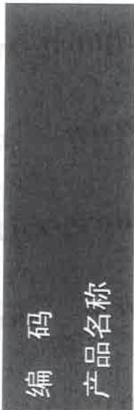
图 E.4 易燃液体类别 4 标签的示例图

远离明火和热表面。一禁止吸烟。 戴防护手套/戴防护眼罩/戴防护面具。 火灾时:使用……灭火。