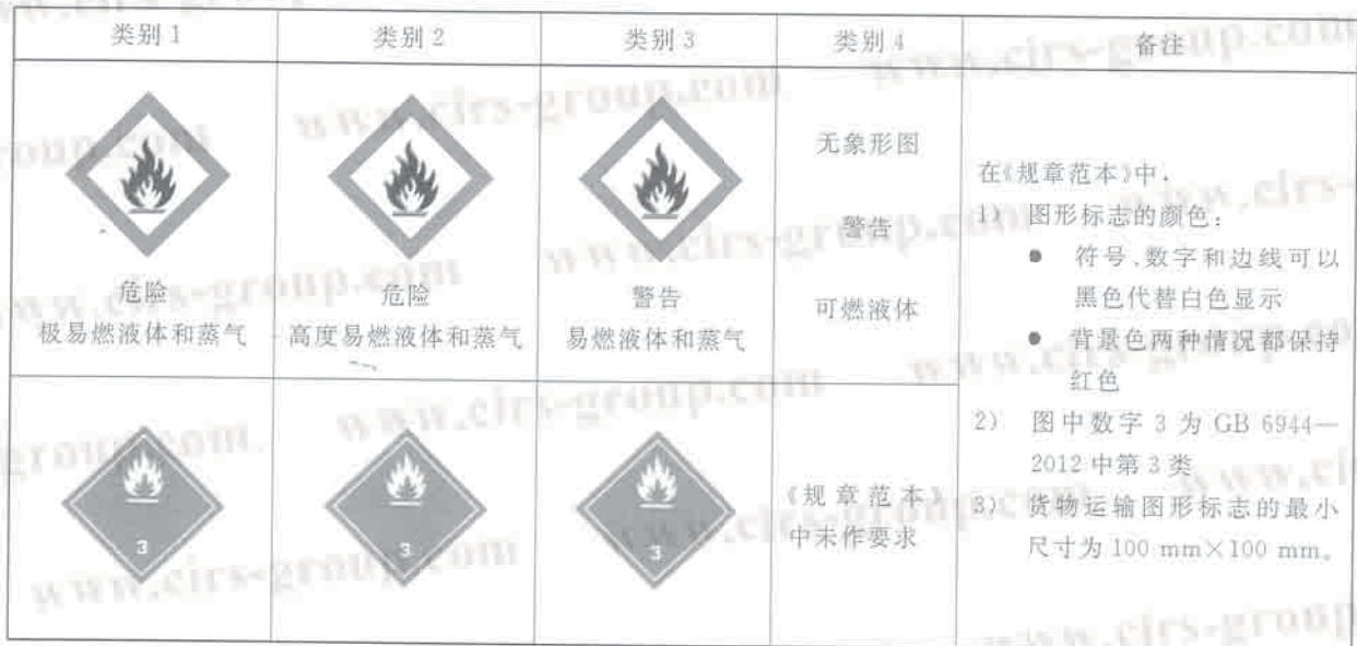
表 B.1 易燃液体标签要素的分配