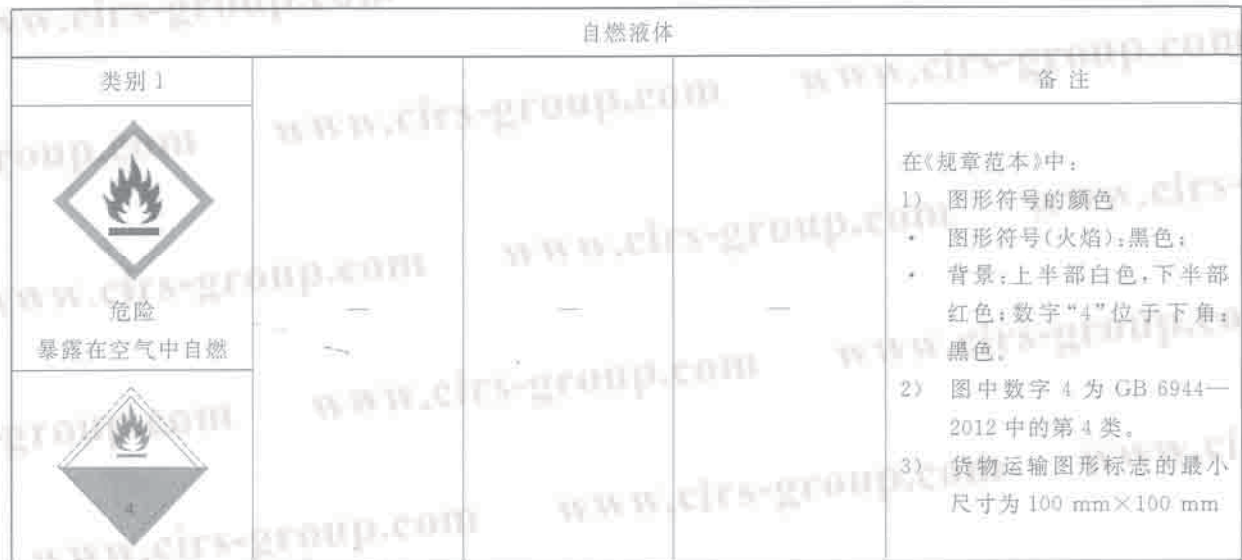
表 B.1 自燃液体标签要素的分配