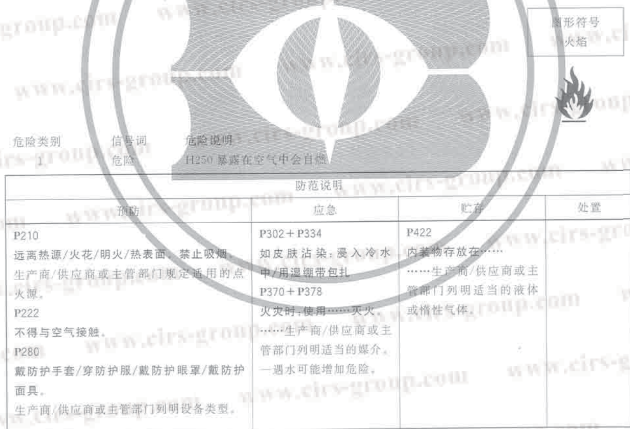
表 D.2 自燃液体的防范说明