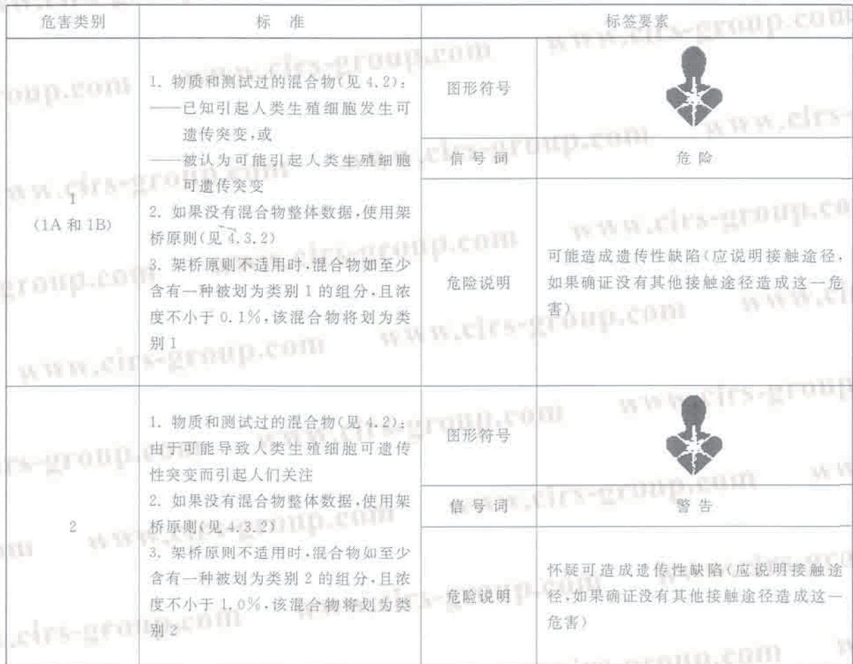
表 C.1 生殖细胞致突变性分类标准和标签要素