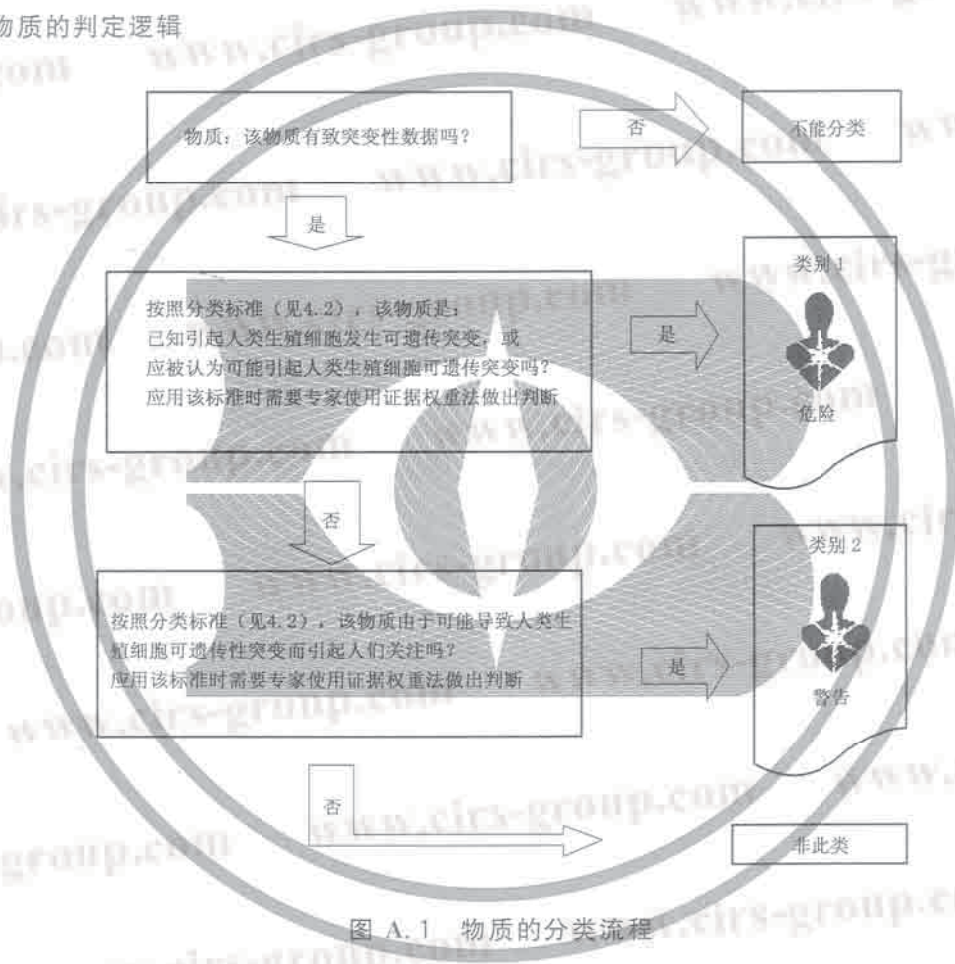
图 A.1 物质的分类流程