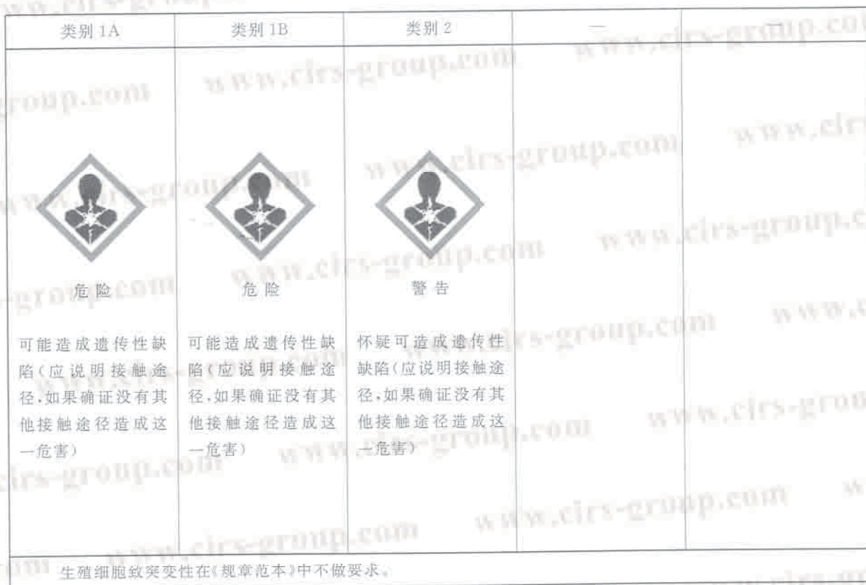
表 B.1 生殖细胞致突变性标签要素的分配