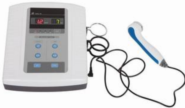
图 2 产品示例