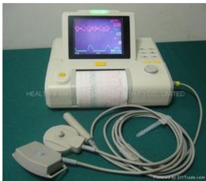
图 2 产品示例

有些设备配有内置打印机的同时，还配有外部打印机或外部打印机接口；显示器也有类似情况。