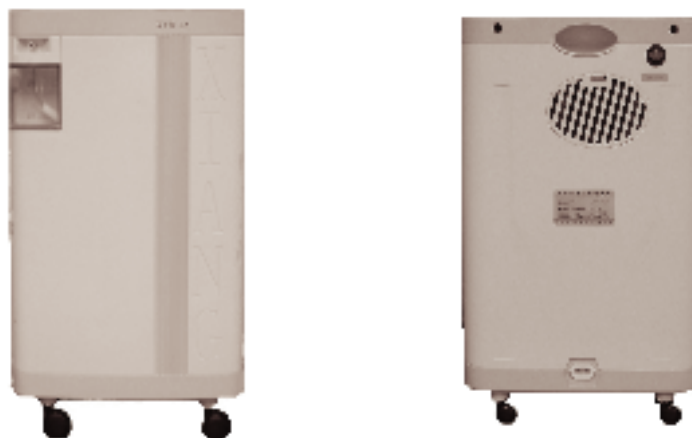
图1 小型分子筛制氧机